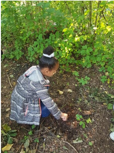
Groep 3 bracht afgelopen maand een bezoek aan het Natuurkwartier. Fijn dat zoveel ouders bereid waren hen te brengen en te begeleiden!