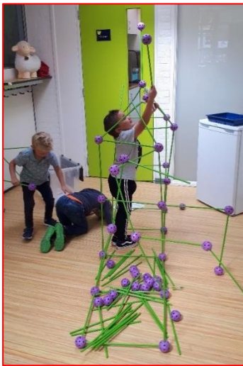
Kinderen uit groep 1/2 werken samen aan techniek opdrachten